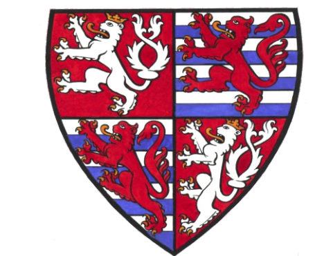
znak Jana Lucemburského

genealogické cesty směřující od knížecí a královské dynastie Přemyslovců k anglickým králům a k lucemburské dynastii