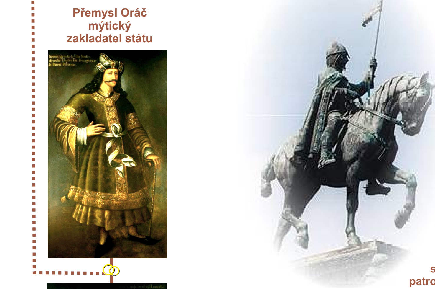
Přemysl Oráč mýtický zakladatel státu

Hostivit Neklan Křesomysl Vnislav Vojen Mnata Nezamysl