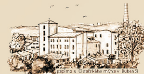
Papírna u Císařského mlýna v Praze Bubenč, kde Piettové také